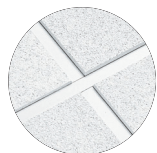
CIRRUS Angled Tegular com perfil PRELUDE® tipo "T" de 15/16"