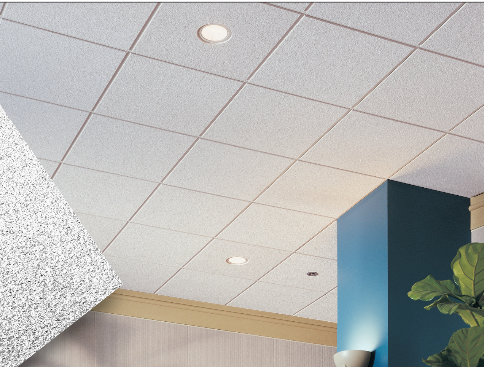
CIRRUS Beveled Tegular com perfil SUPRAFINE tipo "T" de 15/16"